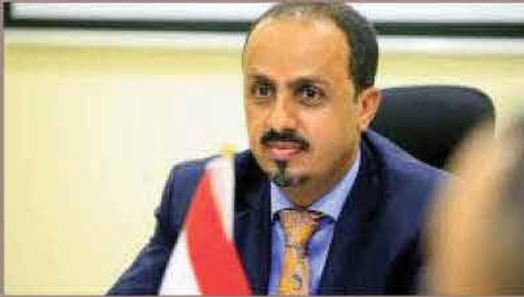
وزير الإعلام معمر الإيراني

استهداف مأرب بصاروخ بالستي صناعة إيرانية تابع من حقد دفين على المدينة وأبنائها الذين كانوا أول من تصدى للمخطط الانقلابي والمشروع الإيراني.