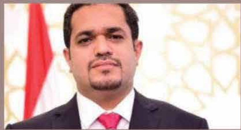
وزارة حقوق الإنسان

مليشيا الحوثي عجزت عن إحداث اختراق عسكري باتجاه مأرب وراحت ترمي حمم فشلها وخيبتها بإطلاق صواريخ بالستية للانتقام من المدنيين.