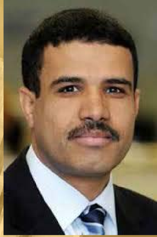
بقلم / محمد جميع