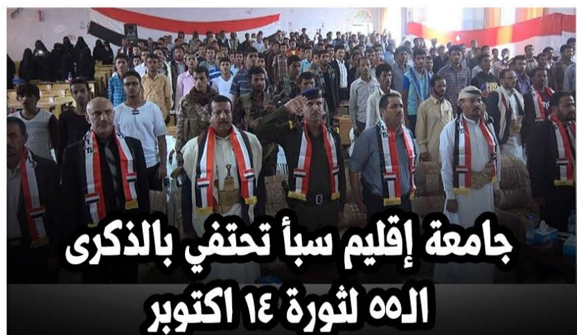
جامعة إقليم سبأ تحتفي بالذكرى الـ ١٤ لثورة ١٤ أكتوبر