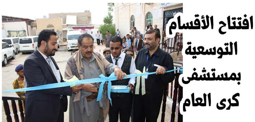
افتتاح الأقسام التوسعية بمستشفى كري العام