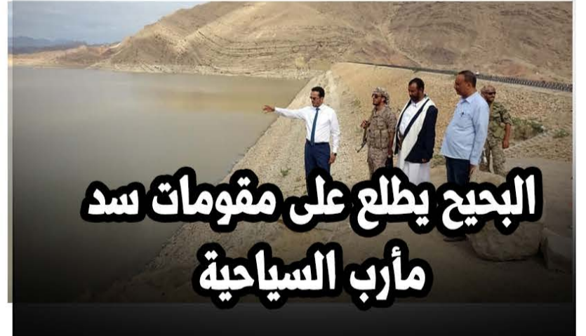
البحيح يطلع على مقومات سد مأرب السياحية