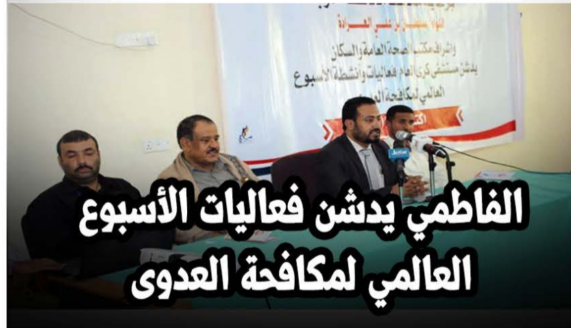
الفاطمي يدين فعاليات الأسبوع العالمي لمكافحة العدوى