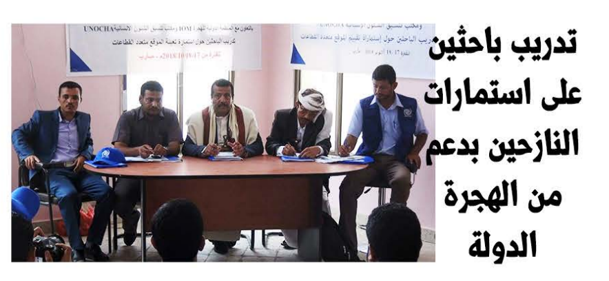
تدريب باحثين على استمارات النازحين بدعم من الهجرة الدولة