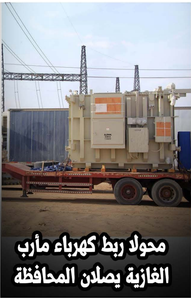
محولا ربط كهرباء مأرب الغازية يصلان المحافظة

- 97٪ من النازحين يتمتعون بالحماية والأمن بشكل يومي - مركز الملك سلمان يتصدر المنظمات الداعمة للنازحين