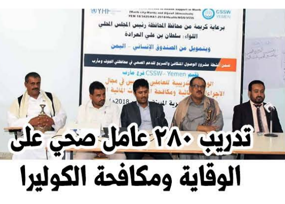
تدريب ٢٨٠ عامل صحي على الوقاية ومكافحة الكوليرا