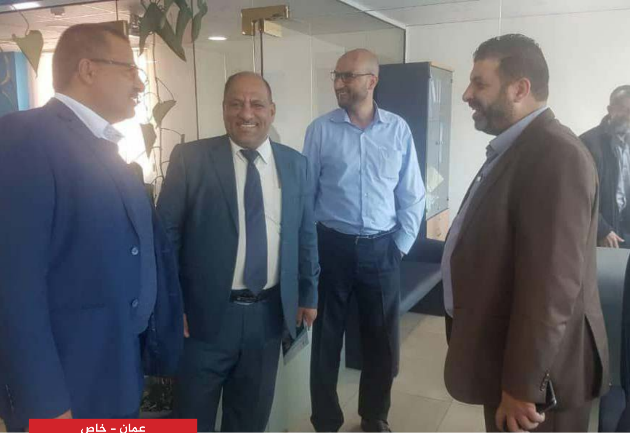
عمان - خاص

تعتمد عليها الأكاديمية في التدريب الاعلامي الحديث. ويشرف على أكاديمية حياة للتدريب الإعلامي عدد من كبار الإعلاميين، وتخرج منها العديد من الإعلاميين الذين أصبحوا اليوم يديرون وسائل إعلامية مرموقة. يذكر أن الزيارة تأتي على هامش ورشة العمل التي أقيمت في العاصمة الأردنية عمان حول فرص، ومتطلبات السلام في اليمن بمشاركة عدد من المكونات السياسية والشعبية ومنظمات المجتمع المدني من محافظة مأرب وحضرموت.