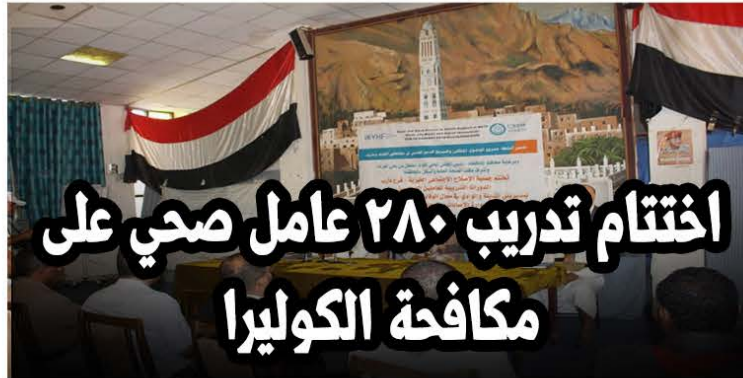
اختتام تدريب ٢٨٠ عامل صحي على مكافحة الكوليرا