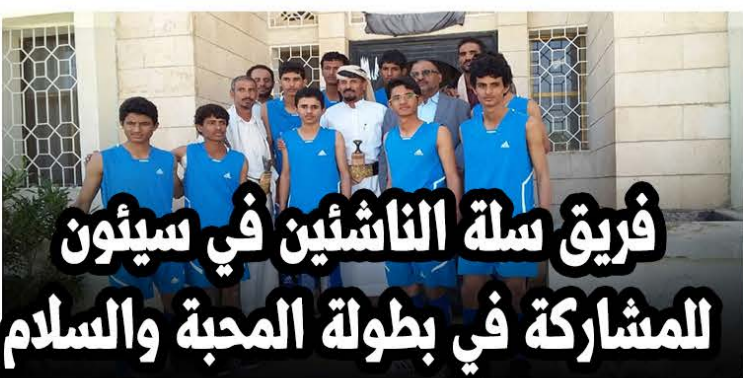
فريق سلة الناشئين في سيئون للمشاركة في بطولة المحبة والسلام