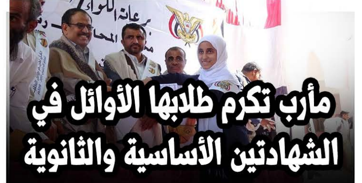
مأرب تكرم طلابها الأوائل في الشهادتين الأساسية والثانوية