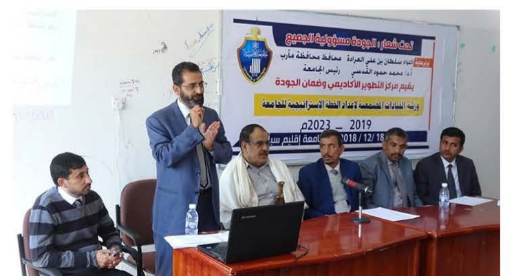
جامعة إقليم سبأ تبدأ إعداد خطتها الإستراتيجية بحضور الفاطمي