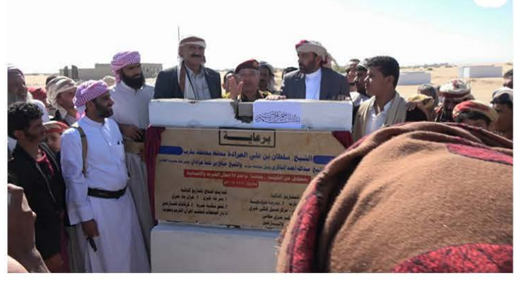
افتتاح ووضع حجر الأساس لـ ١٠٠٠ شقة سكنية بدعم كويتي