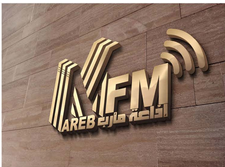
إذاعة مأرب تقر خارطة برامجية جديدة للربع الأول ٢٠١٩