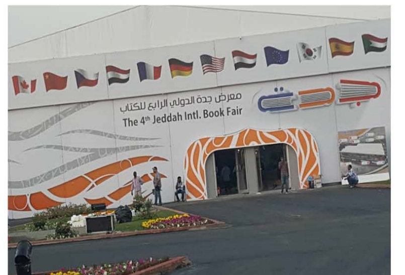
مأرب ترأس وفد اليمن في معرض جدة الدولي الرابع للكتاب