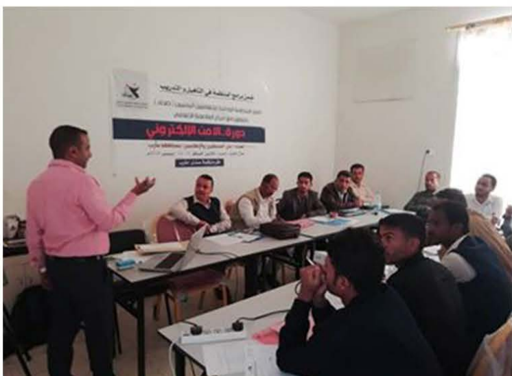
١٩ صحفياً بمأرب يتدربون على الأمن الإلكتروني