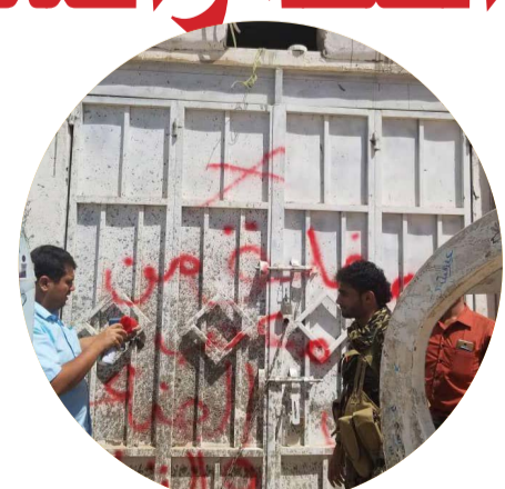
مكتب الصناعة يفلق عدداً من معامل الأيسكريم والمثلجات