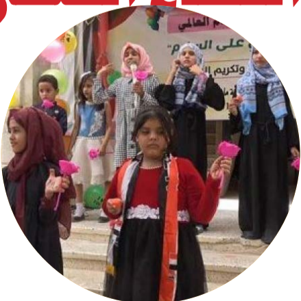
مهرجان فني وزيارات لأمهات المختطفين إحياءاً لليوم العالمي للأمم