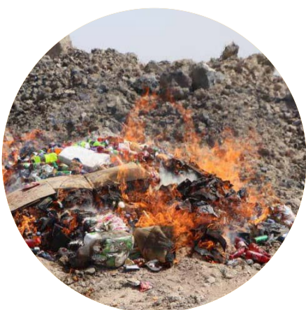
إتلاف كميات من المواد الغذائية غير الصالحة في حريب