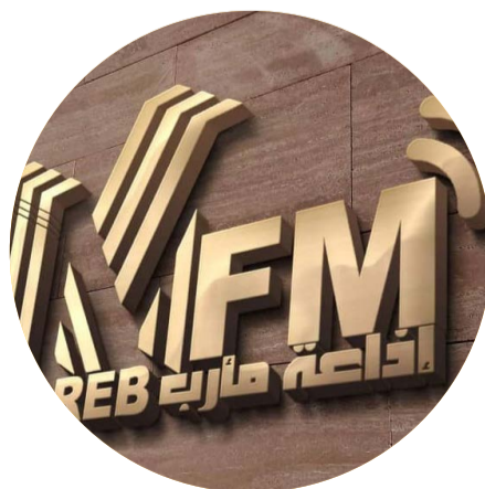
إذاعة مأرب تحتفل بالذكرى السادسة لانطلاقها