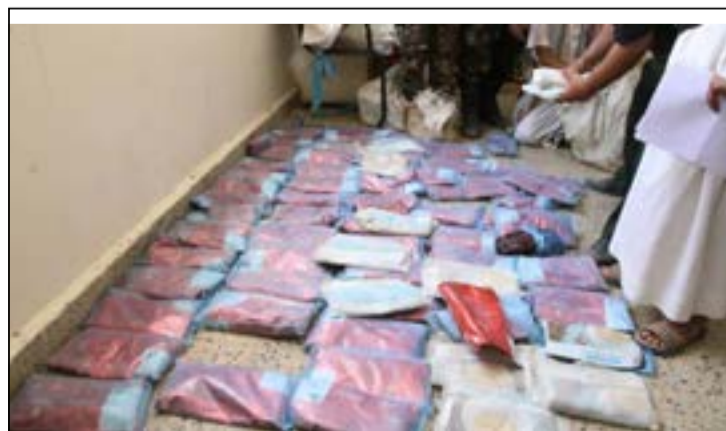
ضبط شحنة جديدة من الحشيش المخدر كانت في طريقها للميشيا الحوثي