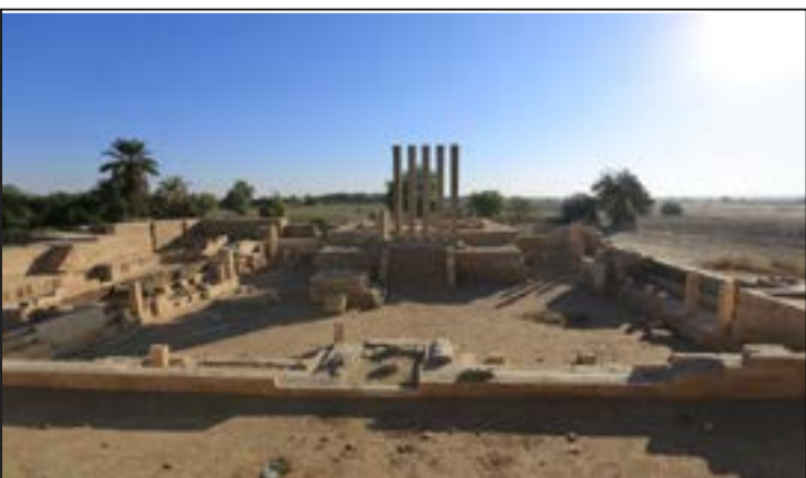
الأغبري: السياحة الداخلية بمأرب تشهد إقبالا غير متوقع خلال العيد