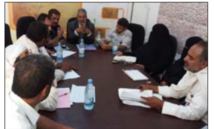
وكيل وزارة الصحة للطب العلاجي يطلع على الأوضاع الصحية بالمحافظة