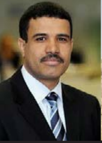
بقلم / محمد جميح

الإصلاح... اختلفوا مع الإصلاح ما شئتم... انتقدوه وجرحوه كما يحلو لكم... لكن لا تنسوا أن مأرب أكبر من الإصلاح ومن المؤتمر.. وأكبر من الحوثيين... مأرب هي اليمن، وهي الجمهورية وهي التي صمدت في وجه كل هذا الظلام الذي لف البلاد من أقصى الجبل إلى أقصى السهل ذات خريف من عام ٢٠١٤.