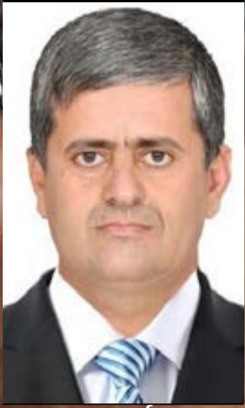
بقلم / أحمد ربيع

واستقرار هذه المحافظة النموذجية ؛ وكذلك أداء أعمالهم باحترافية عالية في ضبط عمليات التهريب التي تقوم بها مليشيا الإجرام الحوثية الانقلابية. ومع هذا لن يتحقق نجاح الأهداف وتستتب الحالة الأمنية وتصل إلى الحالة المثالية إلا بالتعاون المجتمعي العام ، والذي من شأنه أن يسهم في تقوية الصالح العام وفرض هيبة الدولة واحترام الأنظمة والقوانين ونشر هذه الثقافة أوساط المجتمع.