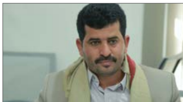
إدخال ١١ مولداً جديداً على الكهرباء