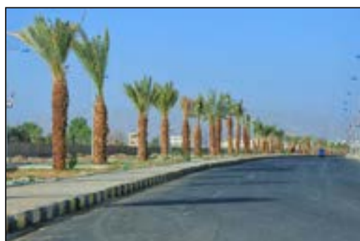
غرس ١٣ ألف شجرة ورصف ٢٦ ألف متر مربع من الشوارع والجزر