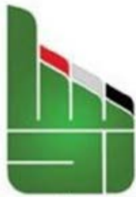
اتحاد الرشاد اليمني