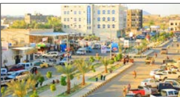
الترخيص لـ ١٤٥ منظمة وجمعية بمأرب